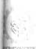
Схема теплоснабжения Некоузского сельского поселения Некоузского муниципального района Ярославской области. Актуализация на 2019 г.