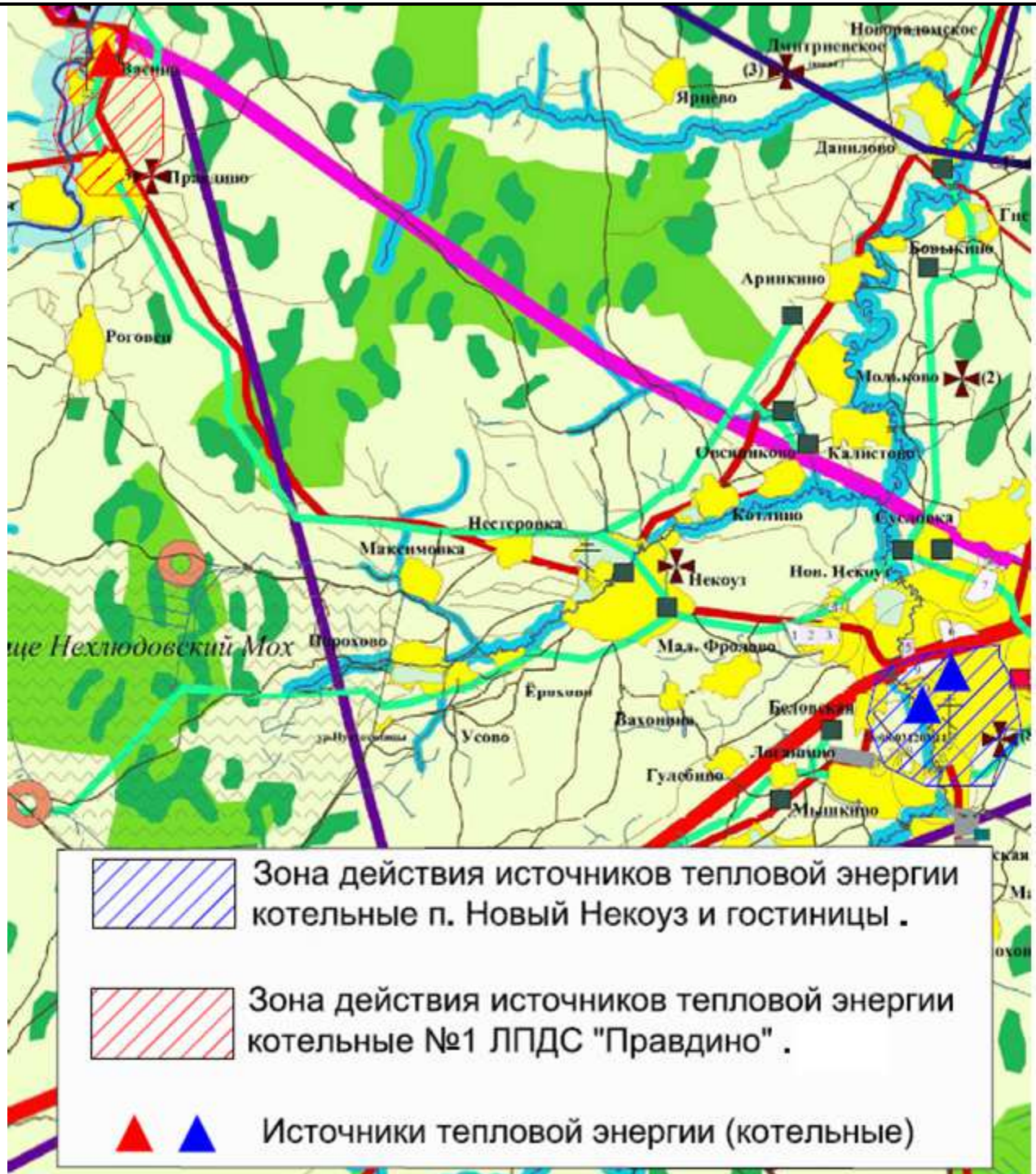
Рис. 2.2.1. Зоны действия источников тепловой энергии Некоузского сельского поселения.